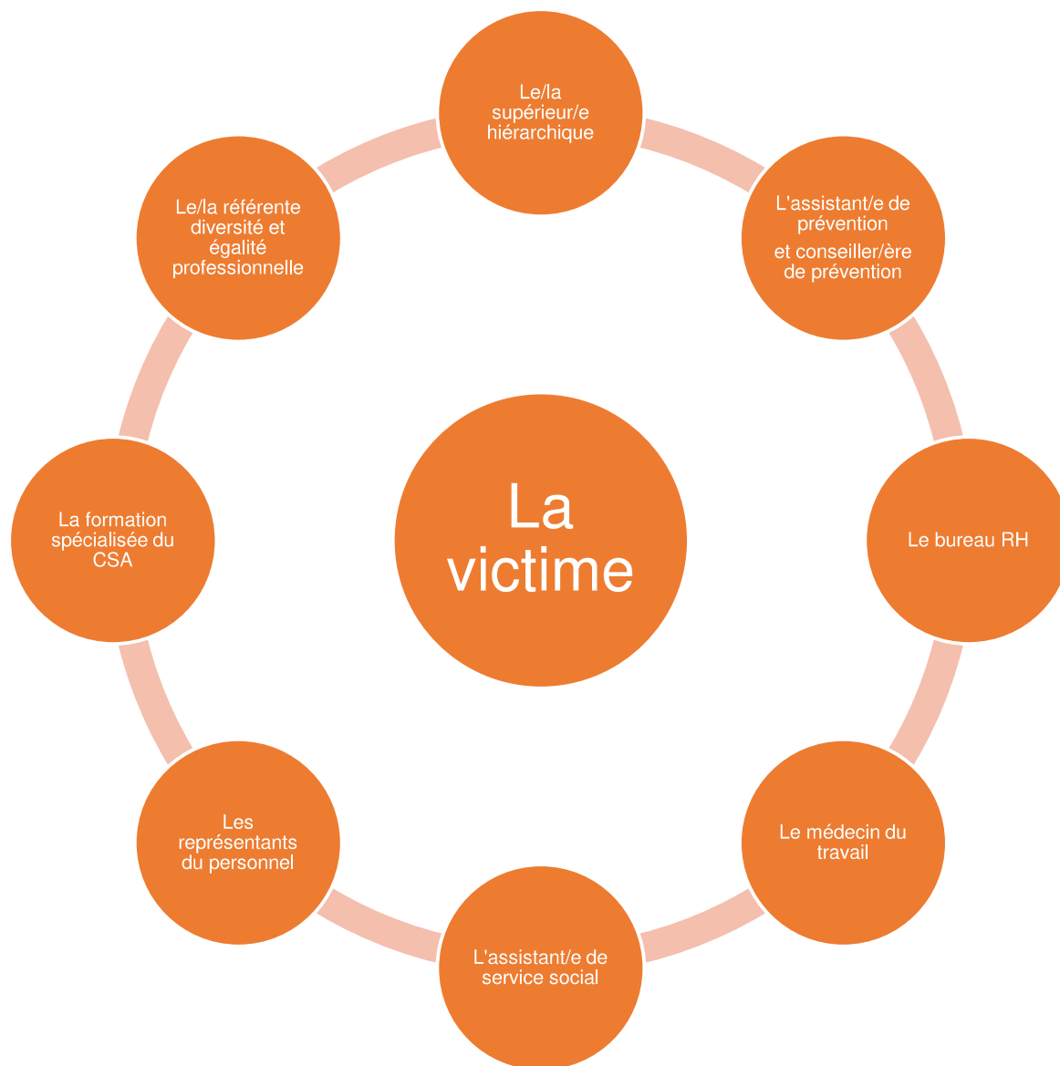
Schéma des intervenants internes qui peuvent être sollicités dans une situation de violence sexiste ou sexuelle